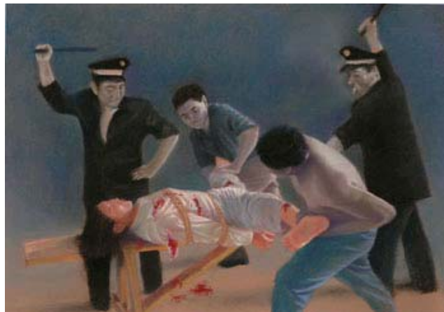
Una pintura describe a dos guardias torturando a una practicante de Falun Gong, con dos prisioneros ayudándolos.

Nadie en los países libres del mundo entiende qué implica para los oprimidos en China defender y demandar sus derechos humanos más básicos, bajo el régimen totalitario del partido comunista chino (PCCh). Mientras nosotros tenemos el Estado de derecho, ellos enfrentan el régimen del PCCh sobre sus espaldas diciéndoles qué tienen que hacer, qué tienen que decir y qué tienen que creer. Mientras nosotros podemos criticar a nuestros gobiernos en una prensa libre protegida por una Constitución, bajo el PCCh el partido es el jefe responsable de lo que ellos pueden saber, de los policías que los arrestan sin causa, del sistema judicial que los declara culpables de violar leyes arbitrarias, sin evidencias ni juicio justo, y de los guardias de las prisiones que los torturan por tener tan solo un pensamiento independiente.